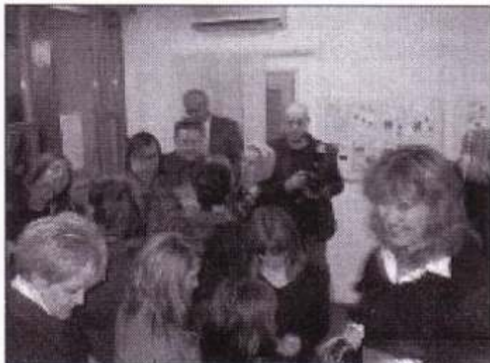
Sa otvorenja izložbe