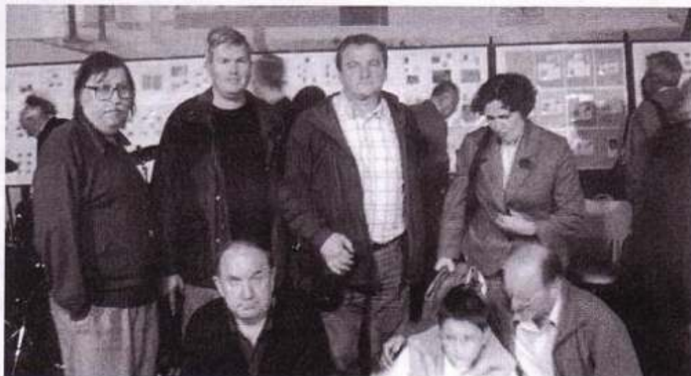
Karlovačka ekipa u Novskoj