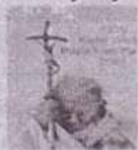
Marka s papom Ivanom Paviom II.