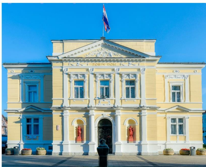
HFD Karlovac br. 134

130. obljetnica otvorenja Zorin doma 27.11.1892. - 27.11.2022.