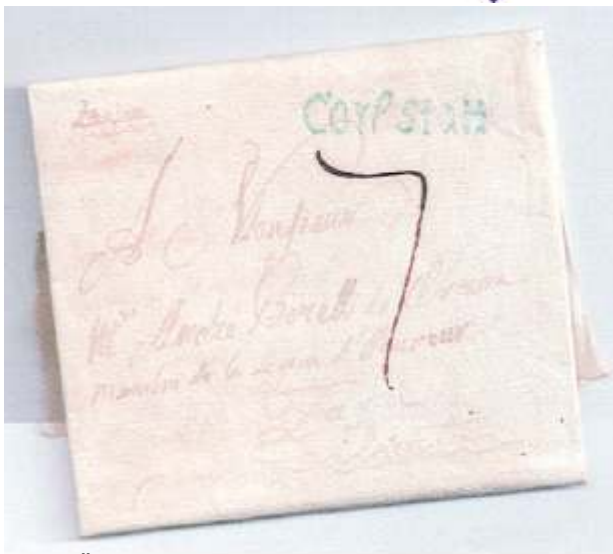
Žig Karlovca u plavoj boji iz 1811.g (žig 7)

Primjena žigova na omotnicama završava u na elu krajem svibnja 1850. g. Prijelaznog razdoblja gotovo da i nije bilo jer je uporaba poštanskih maraka bila odmah obavezna za sve doma e pošte. Iznimka su bila službena pisma (ex officio) a takvih se dosta nalazi i s prvim filatelisti kim žigom Karlovca iz 1850.godine. Cijelu ovu pri u o predfilatelisti kim žigovima Karlovca donekle komplicira nedavno otkrivena korespodencija Borelli de Vrana koja pomi e po etak uporabe nekih žigova. Prvo